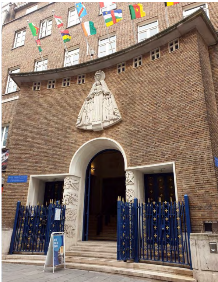
L'entrée de Notre Dame de France à Leicester Square, paroisse catholique francophone.

L'équipe du Dispensaire Français est sincèrement fière et impatiente de reprendre et de renforcer le partenariat établi avant la pandémie et qui consistait à déléguer notre infirmière sur place à Leicester Square, dans les locaux adjacents à Notre Dame de France.