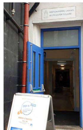
L'entrée du Refugee Centre, surnommée la porte bleue.